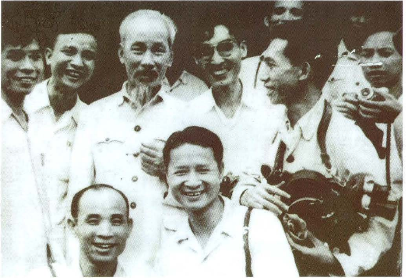
Chủ tịch Hồ Chí Minh với các phóng viên

dục về chính trị, nghiệp vụ và đạo đức. Người nói: "Tờ báo của Đảng có nhiệm vụ làm cho tư tưởng và hành động thông suốt và thống nhất".