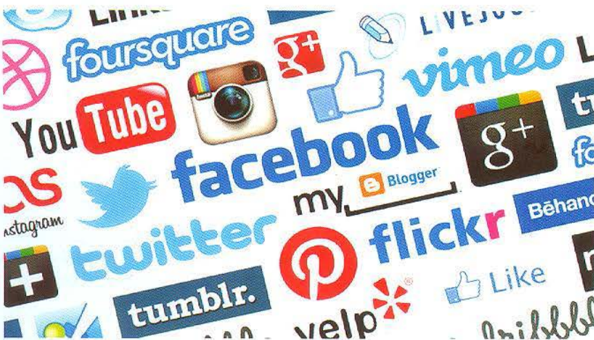
Mạng xã hội với lượng thông tin khổng lồ, phong phú, đa dạng, đa chiều

Hồ Chí Minh cho rằng báo chí cách mạng có chức năng giáo dục, giúp cho dân chúng "mở mắt, mở tai", hiểu biết đúng, sai, chính, tà... Báo chí cần đem chủ trương của đoàn thể, của Chính phủ để giải thích cho dân, để cho mọi người cùng hiểu, cùng đồng tâm hiệp lực làm cho được, đem kinh nghiệm hay việc làm tốt mà phổ biến cho dân chúng noi theo. Hồ Chí Minh còn coi báo chí như là một diễn đàn để huấn luyện và giáo