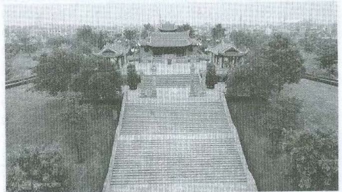
Phía sau Tượng đài là Đền thờ Bác Hồ được xây dựng trên quả đồi cao, uy nghiêm nằm giữa công viên Hoàng Diệu

Lần thứ nhất. Ngay sau ngày Cách mạng tháng Tám năm 1945 thành công, Người căn dặn lãnh đạo tỉnh: Phải đoàn kết toàn dân, đoàn kết các