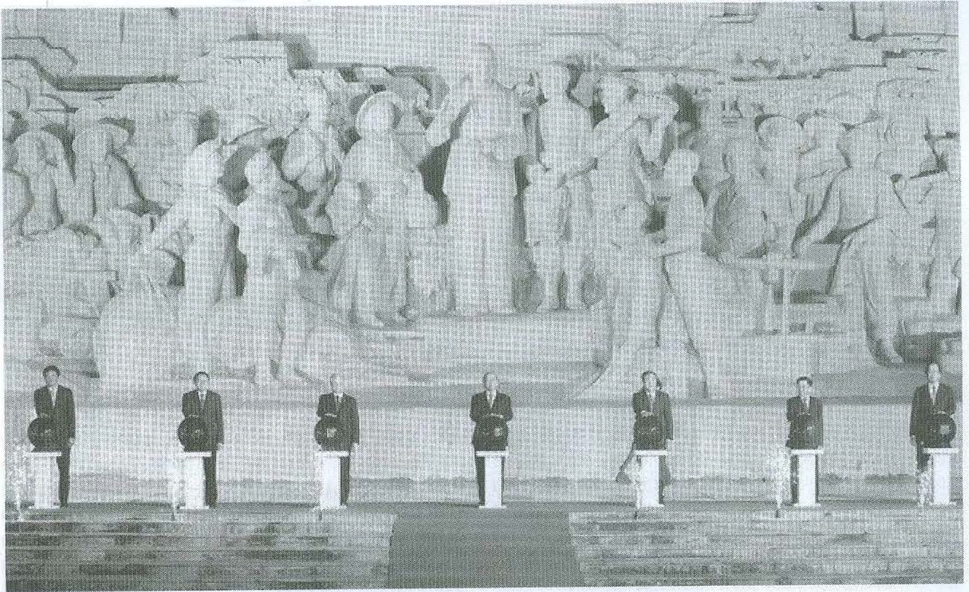
Ngày 12/12/2020: Thủ tướng Nguyễn Xuân Phúc, Thường trực Ban Bí thư Trần Quốc Vượng và lãnh đạo Đảng, Trung ương, lãnh đạo tỉnh Thái Bình nhấn nút khánh thành công trình Tượng đài “Bác Hồ với nông dân Việt Nam”.

xứng đồng đều, mang tính mỹ thuật cao. Tượng đài Bác Hồ với nông dân Việt Nam không chỉ là công trình văn hóa ý nghĩa, là điểm đến hấp dẫn của Nhân dân cả nước, du khách nước ngoài để tri ân công lao to lớn của Chủ tịch Hồ Chí Minh, đây còn là công trình có giá trị lịch sử, lưu giữ trường tồn những tình cảm Bác Hồ dành cho nông dân Thái Bình, cũng như nông dân cả nước.