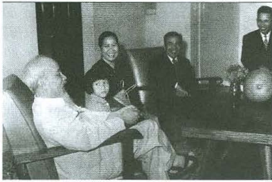
Chủ tịch Hồ Chí Minh tiếp phái đoàn thường trực Mặt trận Dân tộc giải phóng miền Nam Việt Nam tại Phủ Chủ tịch, Hà Nội, ngày 20/12/1966.

Nam yêu quý luôn ở trong trái tim tôi ". Dưới sự lãnh đạo, cổ vũ của Đảng và Chủ tịch Hồ Chí Minh, dưới ngọn cờ đoàn kết cứu nước của Mặt trận Dân tộc Giải phóng miền Nam Việt Nam, nhân dân ta ở miền Nam đã giành được những thắng lợi to lớn. Cách mạng miền Nam từ khởi nghĩa từng phần, phát triển thành chiến tranh cách mạng, kết hợp đấu tranh vũ trang với đấu tranh chính trị, nổi dậy với tiến công trên cả ba vùng chiến lược, tiến công địch bằng cả ba mũi: chính trị, quân sự và binh vận, phá vỡ quốc sách áp chiến lược của chúng, dẫn tới chiến thắng Ấp Bắc (01/1963), báo hiệu phá sản tất yếu chiến lược " Chiến tranh đặc biệt " của đế quốc Mỹ. Phong trào đấu tranh chính trị trong các đô thị, nhất là ở Sài Gòn, Huế, Đà Nẵng cũng ngày một dâng cao, đã đẩy đế quốc Mỹ vào tình thế "tiến thoái lưỡng nan". Hoạt động của Mặt trận dựa trên mục tiêu và nguyên tắc đoàn kết rộng rãi mọi giai cấp, dân tộc, tôn giáo, lực lượng xã hội và cá nhân yêu nước nhằm mục tiêu giải phóng miền Nam, thống nhất Tổ quốc. Trong lời phát biểu tại Kỳ họp thứ 6 Quốc hội Khóa II (08/5/1963), Chủ tịch Hồ Chí Minh nêu rõ: " Đoàn kết chặt chẽ chung quanh Mặt trận Dân tộc giải phóng miền Nam, đồng bào miền Nam không phân biệt gái, trai, già, trẻ; không