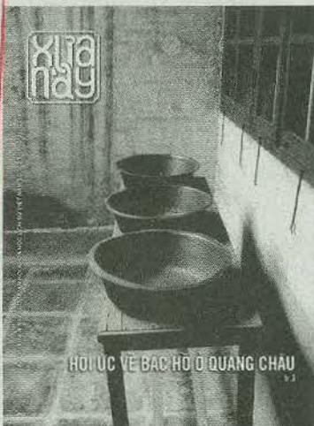
Bìa 1: Di tích nhà bếp 'Lớp huấn luyện chính trị' tại Quảng Châu.