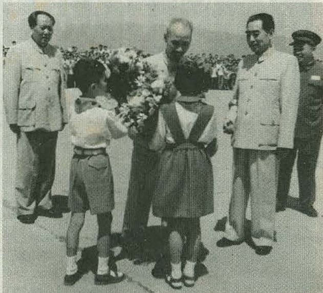
Mao Trạch Đông (trái) và Chu Ân Lai (phải) đón Hồ Chí Minh sang thăm Trung Quốc

đó đã đến sân bay Thập Lý Phố của thành phố Cửu Giang. Khi Hồ Chí Minh vừa ra khỏi máy bay, các ông Dương Thượng Côn, Ưông Đông Hưng đã đón chờ từ lâu liền mang hoa đến, ông Dương Thượng Côn nói to lên: “Chúc Hồ Chủ tịch mạnh khỏe, Mao Chủ tịch cứ chúng tôi đến đón Bác”.