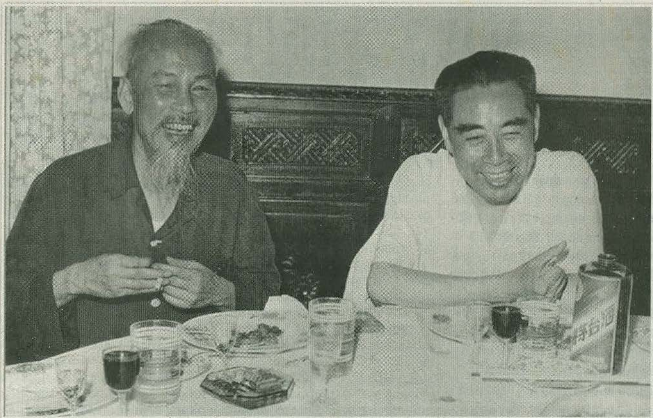
Hồ Chí Minh và Chu Ân Lai

Kinh kịch, cách hát rõ ràng có khác nhau, song động tác múa trong vở kịch thì khác nhau không nhiều?" Ngày thường, Lưu Thiếu Kỳ ít khi bỏ thì giờ đi xem phim, còn xem kịch lại càng ít, nên đành thú thật nói rằng: "Tôi rất ít đi xem kịch, nghe nói các động tác trong Kinh kịch là hay nhất trong các loại kịch, nên các loại kịch khác cũng phỏng theo Kinh kịch". Hồ Chí Minh liền gật đầu nói: "Loại kịch Giang Tây chưa được trình diễn ở Việt Nam, song Việt kịch của Quảng Đông thì ở Việt Nam được người ta hoan nghênh, Việt kịch tương đối chú trọng cách hát".